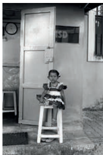
Photographies prises par Marcel Fortini en 2010.