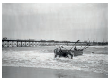
Photographies prises par Mathieu Micheli en 1910.